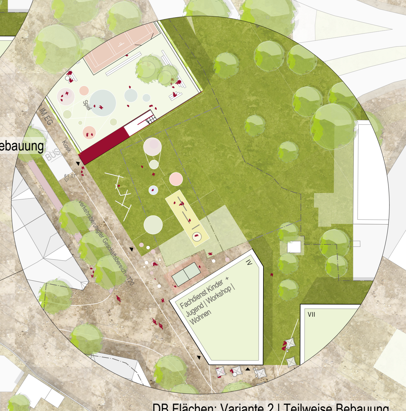
DB Flächen: Variante 2 | Teilweise Bebauung