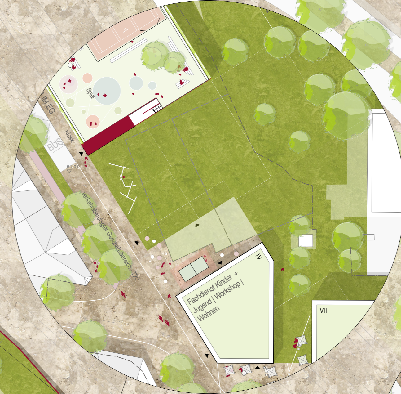
DB Flächen: Variante 1 | keine Bebauung