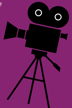
Kamera: © -Anthonyz-Adobe-Stock.com