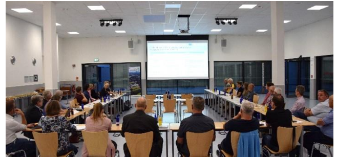
Sitzung der LAG Aue-Wulbeck

Die Lokale Aktionsgruppe (LAG) hat eine zentrale Funktion bei der Entscheidungsfindung über die Verteilung der zugesprochenen Fördermittel in Höhe von etwa 2,8 Millionen Euro für einen Zeitraum von 5 Jahren. Die LAG besteht aus Vertretenden verschiedener Interessensgruppen, dies sind Vertretende der Kommunen sowie Personen aus Wirtschaft und Gesellschaft der Region Aue-Wulbeck. Die LAG trifft Entscheidungen auf Grundlage des Regionalen Entwicklungskonzeptes. Das Regionale Entwicklungskonzept (REK) wurde unter breiter Beteiligung der Akteur*innen der vier Kommunen erstellt und stellt die zentrale Strategie für die regionale Entwicklung der LEADER-Region Aue-Wulbeck dar. Darin sind sowohl die Förderrahmenbedingungen als auch erste Projektideen formuliert und es enthält umfassende Informationen über die langfristigen Ziele und Prioritäten der LEADER-Region Aue-Wulbeck.